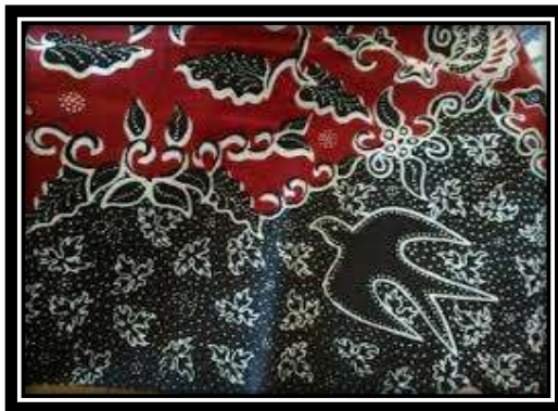
Motif Burung lawet (walet)