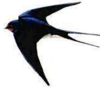
Motif Burung lawet ( walet )