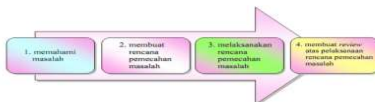
Gambar 2. Langkah Penyelesaian Masalah menurut Polya

Polya dalam http://kangguru.wordpress.com/2007/02/01/teknik-pemecahan-masalah-ala-g-polya/ menyajikan kerangka kerja pemecahan masalah sebagai berikut: 1) Memahami masalahnya, 2) Membuat rencana pemecahan masalah, 3) Melaksanakan rencana, dan 4) Menafsirkan dan mengecek hasilnya.